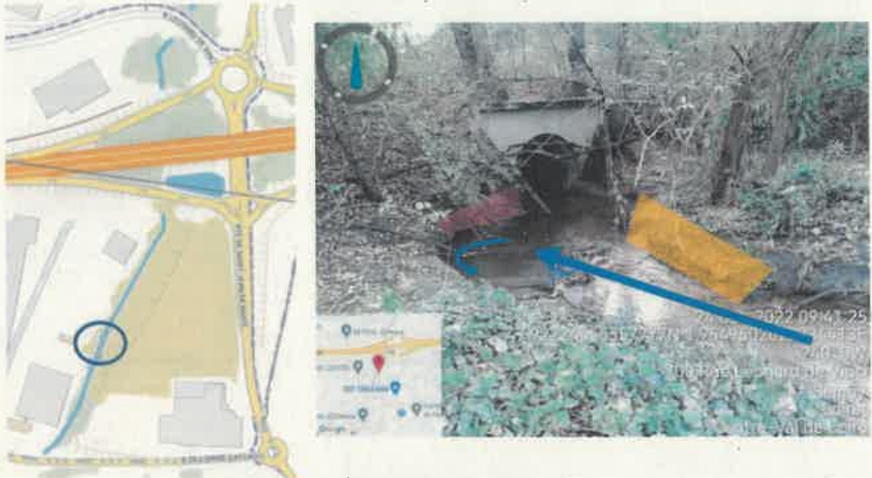
Figure 5 : Tête de buse n°1 à élargir (Flèche bleu = axe d'écoulement ; zone rouge = érosion ; zone jaune = projet d'élargissement).