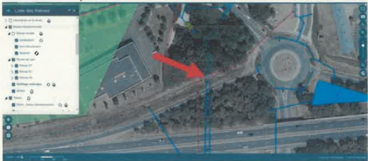
Hydrocurage de la buse n°2 depuis l'entrée jusqu'à la chambre à sable (5 à 8 m)