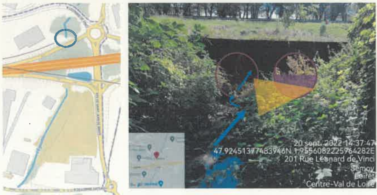
Figure 6 : Tête de buse à élargir (Flèche bleu = axe d'écoulement ; zone rouge = entrée de buse ; zone jaune = projet d'élargissement ; zone violette = niveau d'envasement dans la buse)